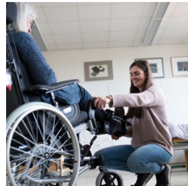
BBS Friesoythe Scheefenkamp